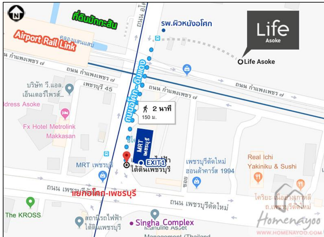
รูปที่ 1.2 แผนที่สังเขปแสดงที่ตั้ง โครงการอาคารชุด Life Asoke (ไลฟ์ อโศก)